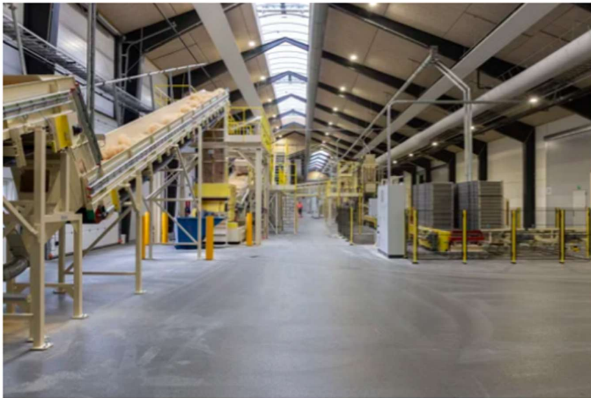
Figure 2 : Installation de production chez Troldekt Acoustic by Kingspan à Troldehede, Danemark

Les seuls processus mineurs exclus sont les cendres biologiques et le gaz combustible consommé sur site.